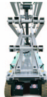
Design nou al sasiului permite curatarea usoara si asigura protectia componentelor