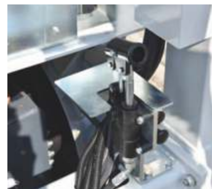
Dispozitiv de coborâre manuala stabilizatori