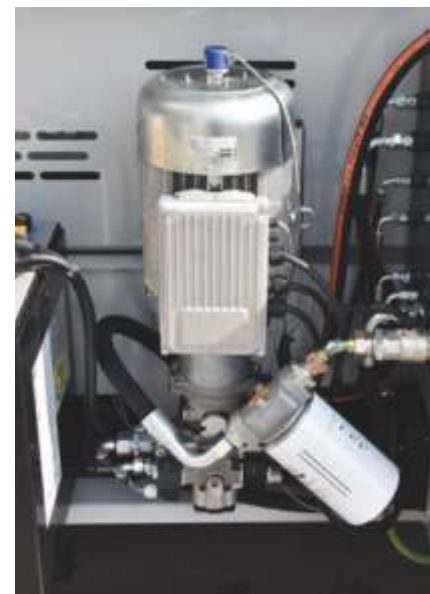
Unitate de alimentare cu curent alternativ