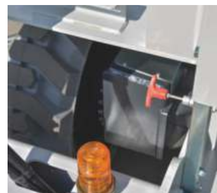
Control manual de coborâre de urgență a platformei